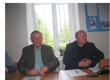
Почесні гості конференції